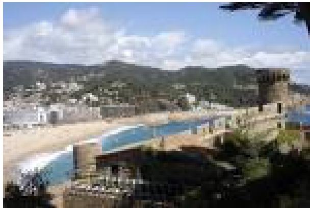
Tossa de Mar