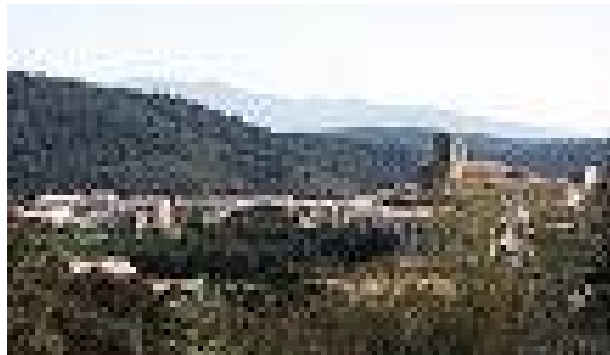
Maçanet de Cabrenys