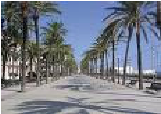
Rambla de Badalona