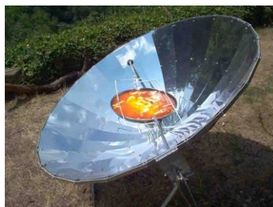
« Cuina Solar i Mediterrània » a Sant Adrià de Besòs